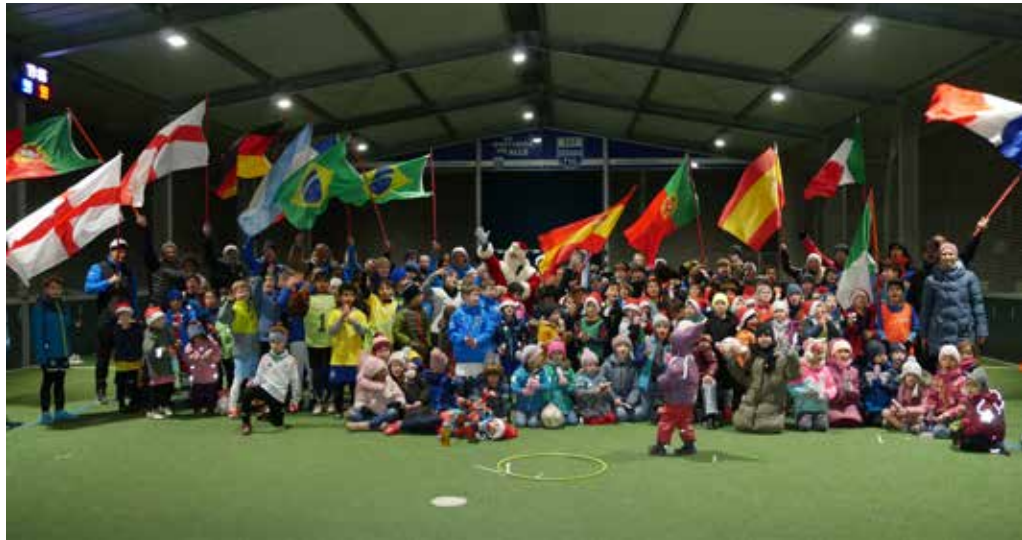
Nikolaus-WM am 6.12.2024 D2 bis Bambinis mit Trainern.

Am 6. Dezember haben die jungen Jahrgänge der Fußball-Abteilung eine Nikolaus-WM veranstaltet. 150 Kinder haben, eingeteilt in 16 Teams, für acht Länder ein Turnier gespielt. 22 Trainer und zahlreiche Eltern haben organisiert und unterstützt, um für die Kinder ein unvergessliches Ereignis zu gestalten, an dessen Ende der Nikolaus zu Besuch kam und jedem Kind, sowie den 50 Geschwisterkindern, einen Schokonikolaus als Preis überreichte. Die Kinder wurden in gemischten Jahrgängen in jeweils acht Länderteams eingeteilt. Die drei älteren Jahrgänge der D2, E2 und E1 (2013-2015) bildeten dabei die acht älteren Teams, die drei jüngeren Jahrgänge F1, F2 und Bambinis (2016-2019) die acht jüngeren Teams. Die Bambinis spielten in Nikolausmützen und ihre Tore zählten 3-fach. 25 kleine Nikolausjoker unterstützten ihre Teams auf den Spielfeldern. Die Teams spielten in 10-Minuten-Runden und sammelten zusammen für ihre jeweilige Nation Punkte. Am Ende folgten Finalrunden, in denen zuerst die jungen Jahrgänge und dann die älteren Jahrgänge gegeneinander für ihr Land antraten. Ein Highlight war das gemeinsame Weihnachts-Singen in der McArena,