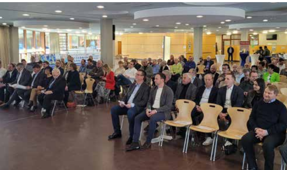
Wenn die TSG Rohrbach einlädt, ist die Hütte voll.