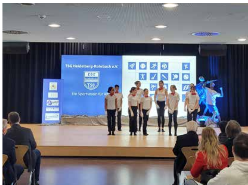
Der Teenie Jazz aus dem Tanzstudio Jump