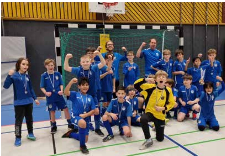
Die E1 beim Heidelberg Winter-Cup.

Im Dezember und Januar nahm unser D2-Team (U12) an zwei hochkarätig besetzten Hallenturnieren teil. In beiden Turnieren brillierten die Jungs und schlugen u.a. den Bundesliga-Nachwuchs vom FC Augsburg mit 4:3, den FSV Mainz 05 mit 4:3 und den FC Heidenheim mit 6:2. Ein 1:1 gegen den 1. FC Kaiserslautern, ein 1:1 gegen Racing Straßburg, ein 3:3 gegen das teilweise ein Jahr ältere Team vom SSV Ulm und ein 2:0 gegen Waldhof Mannheim runden die phänomenale Performance des Teams ab.