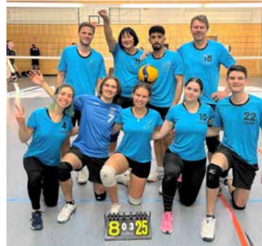
Erfolgreiches Mixed 2-Team. Gewinnen ist geil!

gewann die Mannschaft souverän 3:0 gegen Mannheim-Feudenheim und ebenfalls 3:0 gegen die Gastgeber, den SSV MA-Vogelstang. Damit katapultierte sich die Mannschaft vom letzten Tabellenplatz von insgesamt acht Mannschaften auf den dritten, hinter die VSG Helmstadt 2, die die Tabelle anführt, und die SG Kirchheim 2. Diesen 3. Platz konnte die Mixed 2 bisher halten. Auch am Spieltag vom 2. Februar war das Team erfolgreich. Es gewann 3:0 gegen den TTC Siegelbach und im zweiten Spiel dann wiederum 3:0 gegen Vogelstang. Das ganze Team spielte überragend und spielte sich in einen