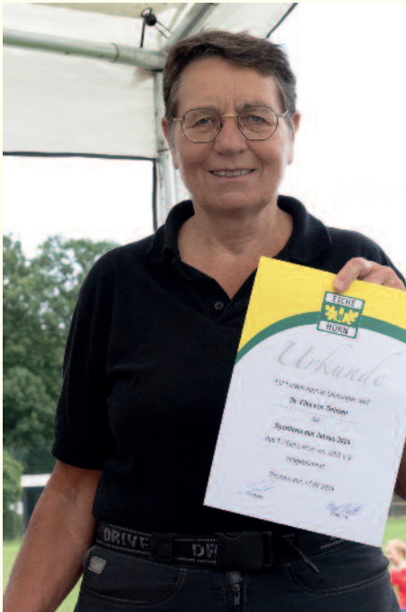
Sportlerin des Jahres Elke von Oehsen