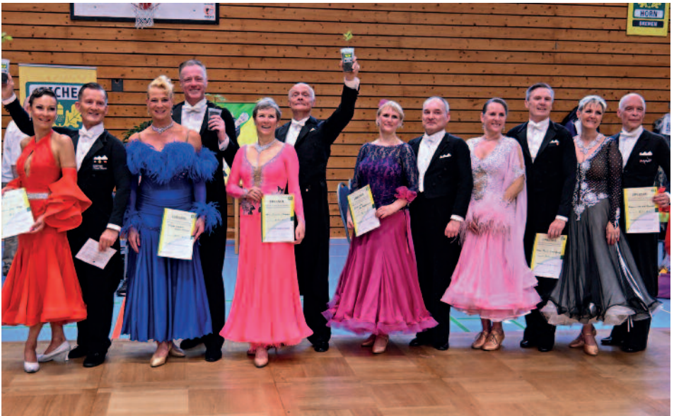
Glückliche Gewinner bei der Siegerehrung der Senioren III