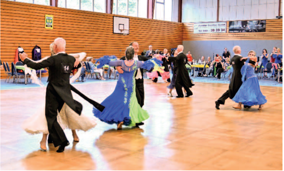
Tanzende Paare beim Turnier