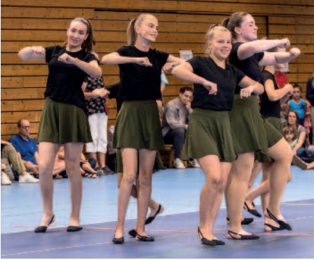
Die Lolitas bei ihrer schwungvollen Vorstellung