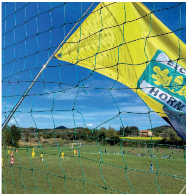
TV Eiche Horn zeigt Flagge in Spanien