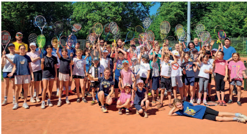
Das Jugend-Tenniscamp 2024 fand unter großer Beteiligung statt