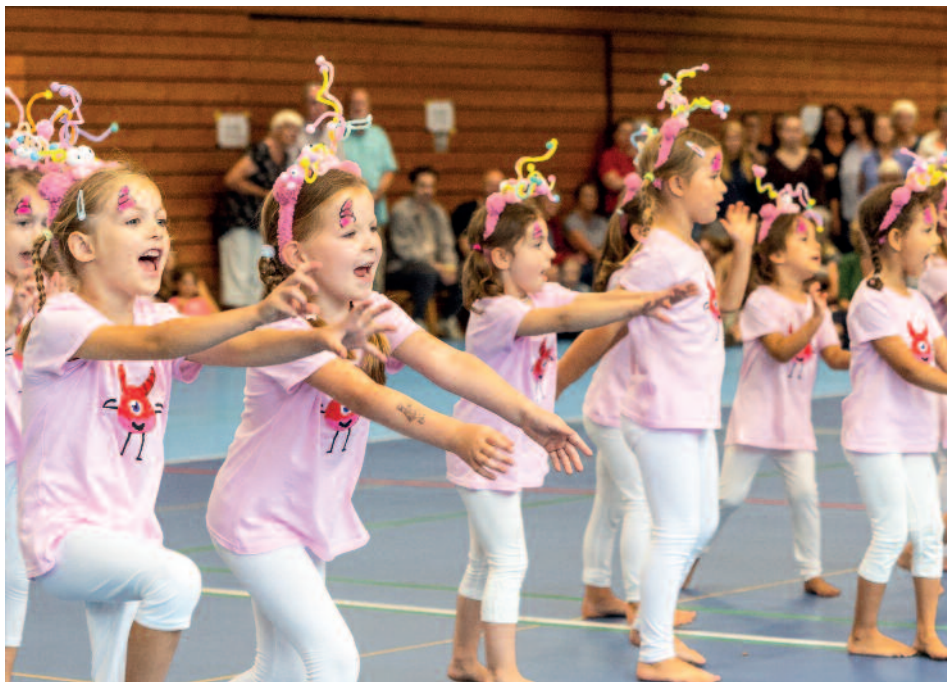
Die Tanzhörnchen hatten ganz viel Spaß