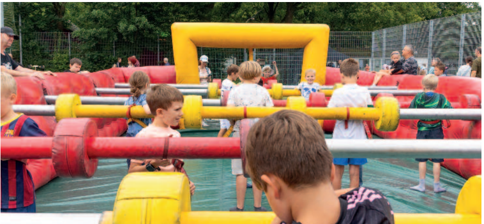
Kinder beim „Lebenden Kicker“