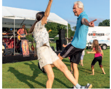
Tanzende Gäste zur Band „Pietze & Co“