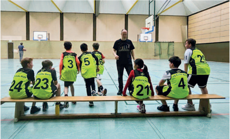
Das Basketballteam vor dem Match