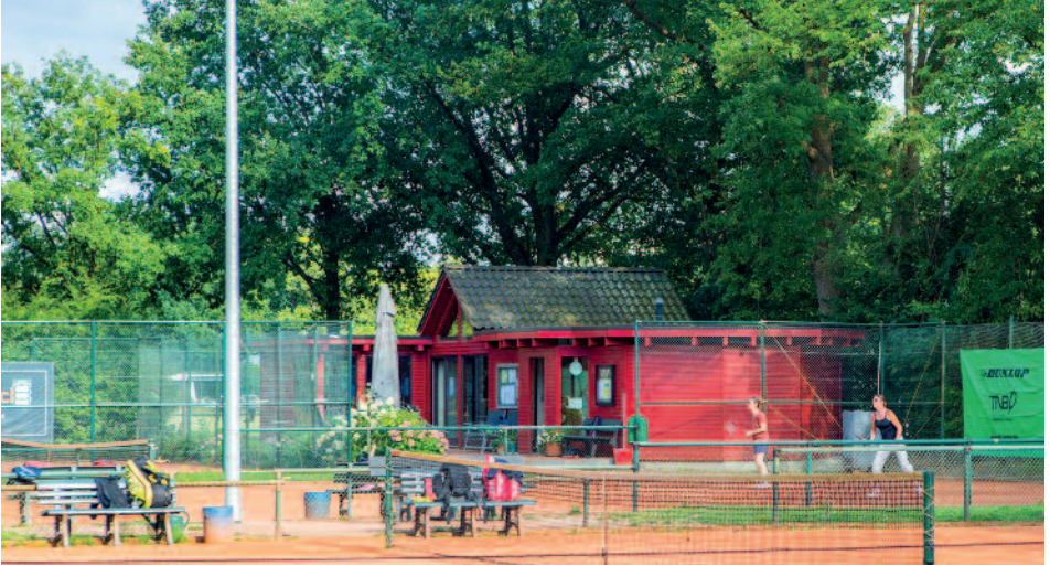
Die Tennisanlage von außen