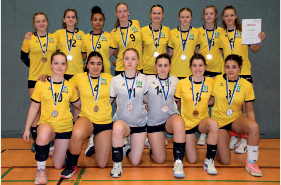
Die Volleyballmannschaft U16w