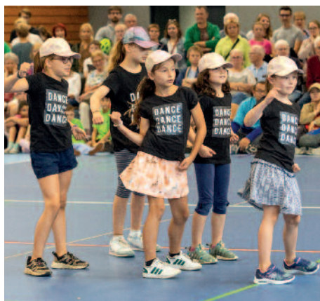
Das war Hip: Die Hip-Hop-Gruppe bei ihrer Darbietung