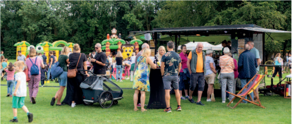
Feiernde Gäste auf dem Eiche-Gelände