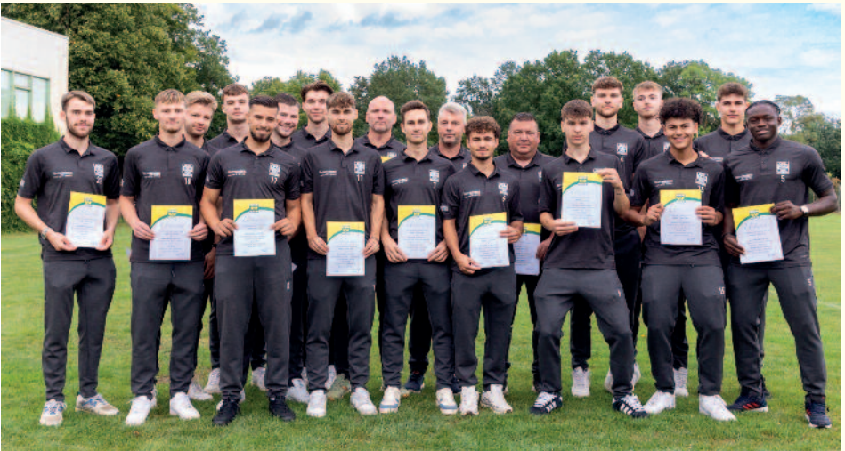
1. Herren Fußball wurde Mannschaft des Jahres