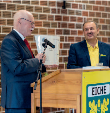
Senator Ulrich Mäurer und Angelo Caragiuli