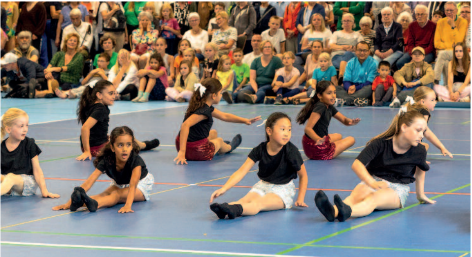
Die Little Stars in Aktion